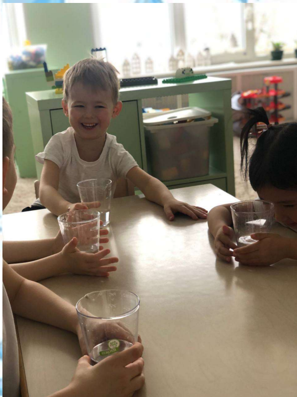
Не имеет запаха